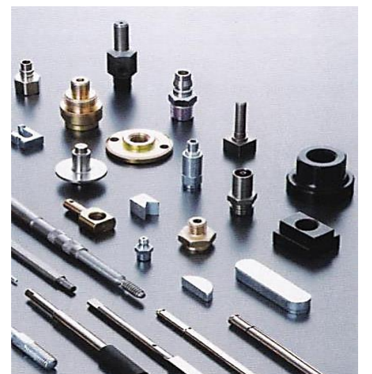
派生品・二次製品

江戸末期の天保年間、東大阪の高人が、京都のかんざしに使う銅の線材を依頼された。そこで、樫の木の丸太に孔をあけて、人力によって引張る伸線が始めた。銅や真鍮を用いて、足袋のこはざや櫛、かんざし、縫い針などに加工していた。 東大阪には約6000の事業所がある。中小企業が密集しており、社員数20名以内が90%を占める。そのうち、金属製品製造業が1653社を占め、全体の28%で最も多い。 江戸期 江戸時代から、鋳物工業、伸線工業、木綿産業が発達した。伸線とは、線材(針金、ワイヤー)の直径を細くし、長さを伸ばすことである。 明治期 明治初期になって、人力による伸線が、初めて水車を動力として行われた。 以後、水車による伸線工場が、枚岡地区、特に豊浦谷で、集中して立地するようになった。ただ水車は、主に農業用に利用されたので、伸線の動力としては、