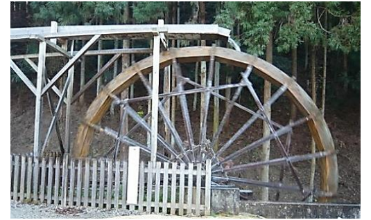
生駒七谷の水車(復元)