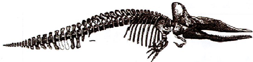
マッコウクジラ骨格図 (BENDEN & GERVAIS 1879による)

現在に比べて海面が4~5mほど高くなり、海水が陸地奥深くへ浸入した現象をさします。この時期の日本列島は、今よりも数℃以上気温、水温が温暖な時期であったと推定されています。海進の原因も氷床の溶融、海水増加の荷重による沈降・隆起等の諸説があります。