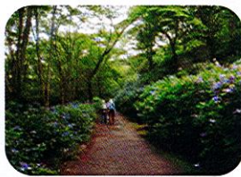
府民の森・あじさい園 (2021.7.4)

☆スタッフ募集中 歩くこと好きな貴方 企画・計画お任せ ○「友の会」会員募集中 12月から来年度会員を募集 会員には行事案内を送付 スタッフ・会員申込みなど下記まで